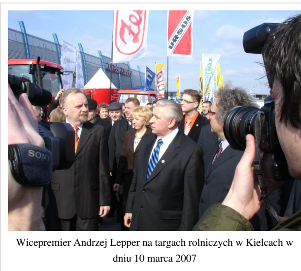
Wicepremier Andrzej Lepper na targach rolniczych w Kielcach w dniu 10 marca 2007

Posiada trzy tytuły doktora honoris causa: Międzyregionalnej Akademii Zarządzania Personelem w Kijowie (z 2004 za osiągnięcia w zbliżaniu we wzajemnych kontaktach między narodami polskim i ukraińskim ) oraz Ukraińskiej Akademii Technologicznej (z 2005 za działalność na rzecz zbliżenia polsko-ukraińskiego i wkład w rozwój socjalny polskiego społeczeństwa ) [14] . Trzeci przyznany przez Moskiewską Państwową Akademię Precyzyjnej Techniki Chemicznej im. Michaiła Łomonosowa odebrał 12 lutego 2007 [15] .